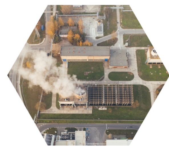
Problem ile ilgili veriler toplama:

Öncelikle problem belirlenecek. Konu belirlenirken kursun kalemle ilgili kursun elementi zehirli bir element iken neden sürekli elimizde olan bir araçta kullanılmış olabilir?